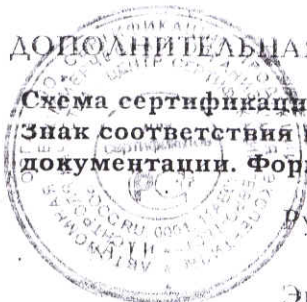
Схема сертификации №3. Сертификат без приложения не действителен Знак соответствия проставляется на упаковке изделия и/или товаросопроводительной документации. Форма и размеры знака соответствия по ГОСТ Р 50460-92.